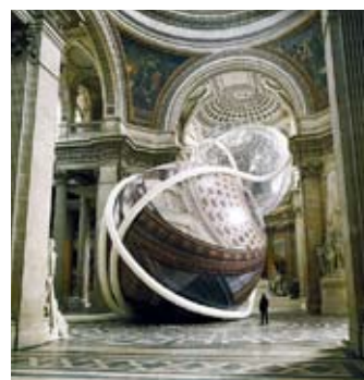
Klaus Pinter : Rebonds, Panthéon, Paris