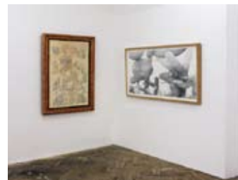
Corentin Grossmann, Wim Delvoye

"Neuf fragments de petites choses instantanées" (2007, 25mn VF) Projection à l'occasion du mois du documentaire présenté par caméra stylo. Samedi 28 novembre à 15h, Bibliothèque 2°, 13 rue de Condé, 69002 Lyon.