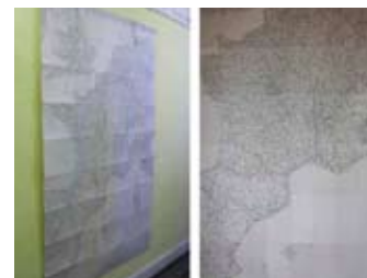
Benoît Billotte, Nexus, dessin sur papier 2009