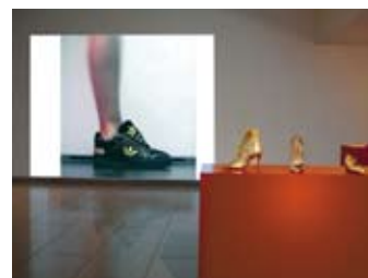
Olivier Lounissi, gauche - droite, video 2007