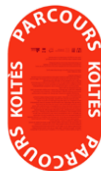
recto du plan édité, parcours Koltés