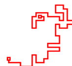
de haut en bas : Se Lyung Moon "Zang Zeung" G. Lemuhot "Fil d'ariane" (détail)