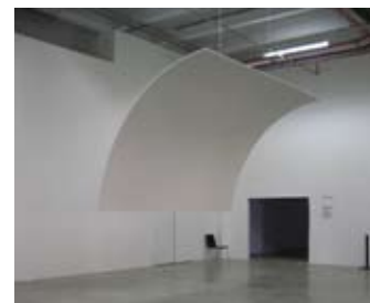
Affinity, 2009, Palais de Tokyo

Images en Scène / Hélène GUILLAUME - salle vidéo